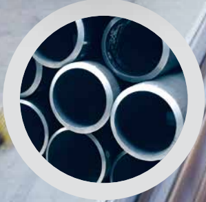
STAHLROHRE NACH API SPEZIFIKATION